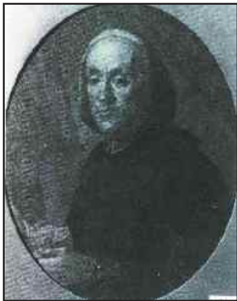
Ignoto toscano del XVIII sec. Ritratto di Antonio Niccolini Cortona – Museo Accademia Etrusca

la carica di Lucumone (presidente) per due anni successivi (nel 1759 e nel 1760).