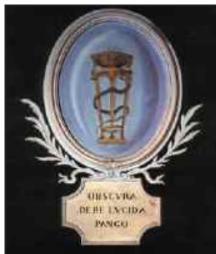
Stemma dell'Accademia Etrusca