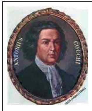
Ignoto toscano del XVIII sec Ritratto di Antonio Cocchi Università di Firenze