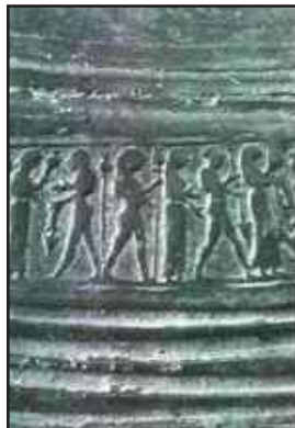
Anfora etrusca di bucchero pesante (e particolare) VI sec. A.C. dono di Philipp von Stosch all'Accademia Etrusca Cortona – Museo Accademia Etrusca

Personalmente ritengo che il maggiore ricordo della loro presenza a Cortona sia un altro: la Tanella di Pitagora .