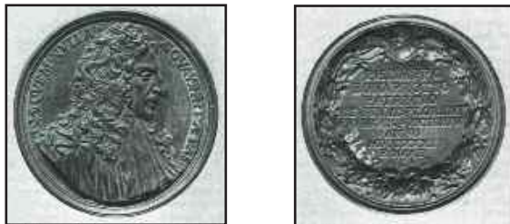
Antonio Montauti 1731 – medaglia di Filippo Buonarroti (1661–1733) Cortona – Museo dell'Accademia Etrusca

delineare una delle figure chiave di questo periodo: quella di Filippo Buonarroti 3 .