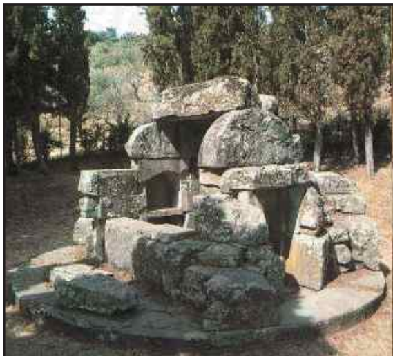
Tomba etrusca a tumulo (III sec. A.C) nota come “Tanella di Pitagora” Cortona – loc. Madonna del Calcinaio

identificare la stessa come tomba di Pitagora (il termine tanella equivale a piccola grotta ).