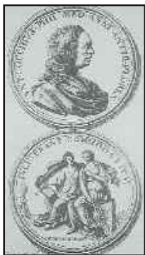
Andrea Scacciati XVIII sec. Incisione per progetto di medaglia per Antonio Cocchi

Le due cose, chiaramente, non collimano ma tornano a collimare se si considera un fatto: anche se il primo italiano che entra a fare parte della Loggia è Antonio Cocchi (4 Agosto 1732) inizialmente la Loggia è costituita da soli inglesi—i primi ingressi di fiorentini risalgono a circa 1734–1735 14 .